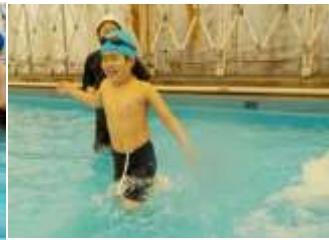
ジャブジャブ歩いてみよう！