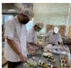
1年生:校内で職員向けの昼食弁当づくりの様子

6月に、2週間の前期校内・現場実習を行いました。1年生は校内で除草活動や職員向けのおにぎり弁当作りをしました。2、3年生は自宅からそれぞれの希望事業所に通勤し取り組みました。