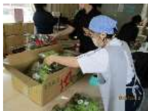
2年生:各事業所での活動の様子